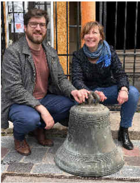
Descente de notre cloche début mai