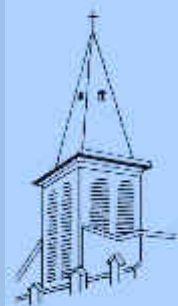
SAINT ETIENNE Le Perreux

EGLISE PROTESTANTE UNIE DE FRANCE communions luthérienne et réformée