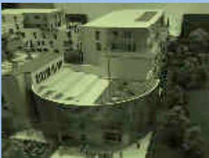
L'UNITÉ Noisy-Le-Grand ☎ 07.83.50.63.11