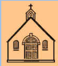
SAINT MATTHIEU Pontault-Combault ☎ 01.60.28.55.28